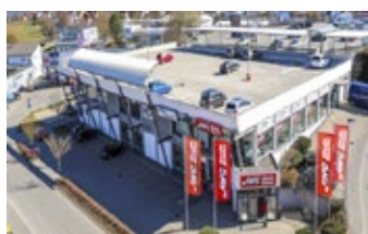
Zimmern ob Rottweil